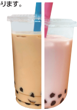
通常のコップ HF89-14 (20F)

底の部分に丸みがあり、タピオカが吸いやすい形状になっています。また、下部にある線が目立たないので中身の存在感がしっかり伝わります。