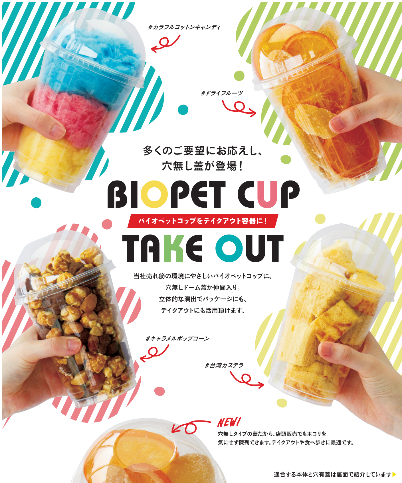
#カラフルコットンキャンディ