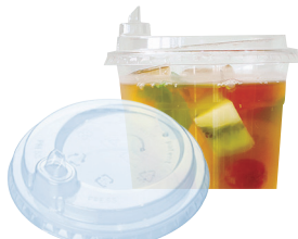
ストローレス蓋(穴有)

十字型のストロー穴がある、オーソドックスなタイプの蓋です。アイスコヒーやジュースなど、幅広くご利用いただけます。